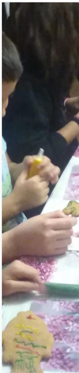
Výroba perníčků s dobrovolníky

prostřední a v ranním provozu. Děti na distanční výuce mohly využít klubové počítače, a další techniku ke zvládnutí školních povinností. Posílili jsme spolupráci s místními základními školami a poskytovali doučování v prostorách Klubu, a pro žáky, kteří se do našich prostor nemohli dostavit, nově i na dálku přes internet. O doučování byl vysoký zájem, službu kontaktovali rodiče, vyučující i sociální pracovníci z dalších institucí a úřadů. Pokračovalo až do konce školního roku následujícího léta.