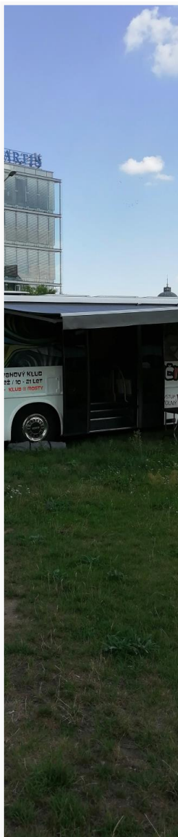
Mobilní NZDM - Streetbus Uličník

Celý rok poznamenala opatření a omezení způsobená pandemií. Služba během roku přizpůsobila svou nabídku nové situaci dětí, denně pracovala v online prostředí, zavedla dopolední provoz a vytvořila unikátní prostor pro ošetření nových zátěží spojených s distanční výukou a zásadními změnami v možnostech trávení volného času dětí. Studijní a odpočinková místnost v závěru první vlny distanční výuky byla v odborných kruzích oceňována jako inovativní řešení. Během léta jsme zorganizovali pětidenní výjezd do Brna a jednodenní výlet do Pardubic. Podzimní vlnu pak služba znovu zvládala v online