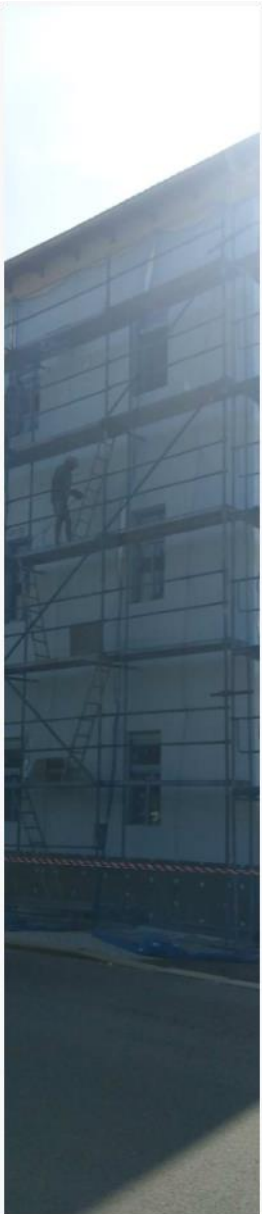
Úvodní fáze rekonstrukce Azylového domu v Ml. Boleslavi