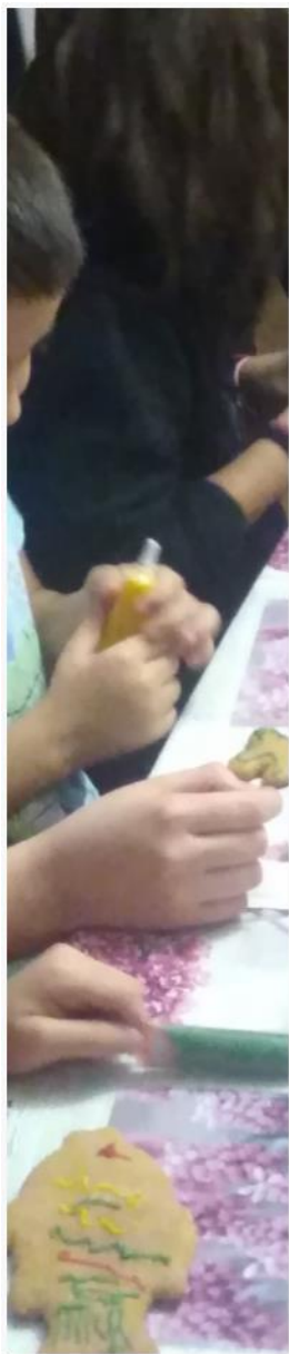
Výroba perníčků s dobrovolníky