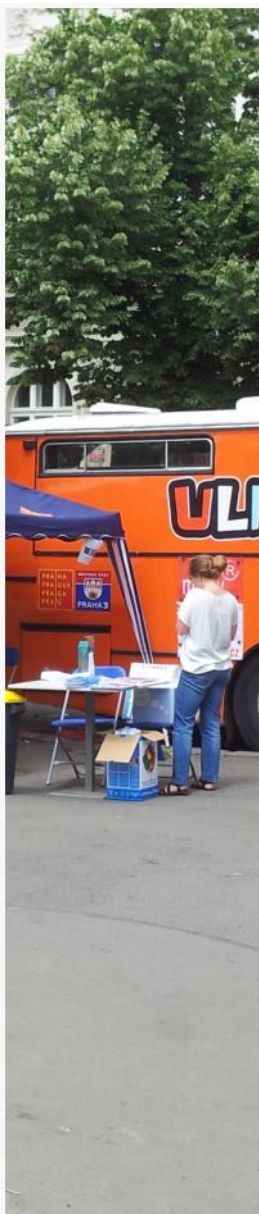
Mobilní NZDM – Streetbus Uličník