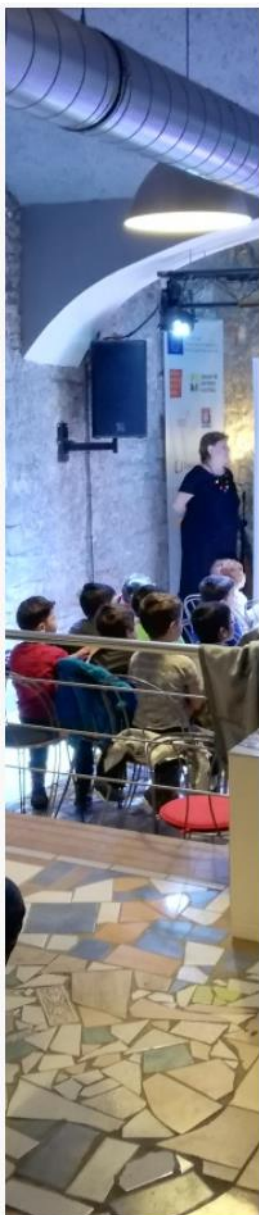
Program pro školy

Vedle pravidelných akcí KCH / SUTERÉN probíhaly rozličné worskshopy & besedy & jednorázové akce ( www.husitska.eu/program ). Mezi nimi například projekce filmu Dospělým ze dne na den s navazující besedou s protagonisty snímku, kteří absolvovali ústavní péči, workshop pro pedagogy – Škola bez poražených, projekce ekologického snímku pro veřejnost v režii studentů VŠE, arteterapeutické workshopy (Kolář, Miró), výtvarné a rukodělné workshopy pro rodiče s dětmi, beseda s pěstouny pro zájemce o pěstounskou péči, workshop o seznamování zaměřený také na problematiku seznamování & duševních obtíží (Psychoseznamka.cz). Informační seminář o dobrovolných návratech občanů třetích zemí (informativní diskusní fórum ve spolupráci s IOM, workshop KLAUNI, Řeč těla a neverbální komunikace I. a II.