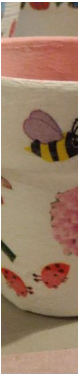
Rukodělné techniky - decoupage (ubrousková technika)

není nijak na újmu nízkoprahovosti zařízení. Každou středu probíhá tvořivý aktivizační kurz, kterému jsou věnovány 2 hod. Na aktivitách rukodělné tvořivosti participovali klienti i jako organizátoři kurzu.