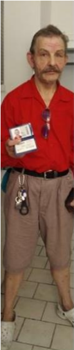
Klient KCH s vyřízenou novou tramvajenkou