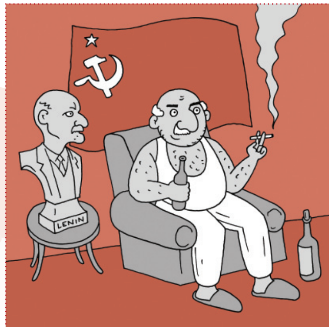
... TO BYLO DŘÍV ZA KOMUNISTŮ

Čím ale půjdete vejš, tím líp a s větším respektem s vámi budou zaměstnavatelé zacházet.